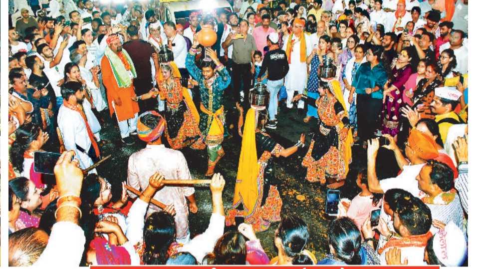
राजस्थानी नृत्य रहा आकर्षण का केन्द्र

आतिशबाजी, पुष्पवर्षा से स्वागत किया, पेय पदार्थ का वितरण किया। जहां से भी शोभायात्रा निकली, समाज के लोग भगवान झूलेलाल को प्रसाद चढ़ाकर आशीर्वाद लिया, पूरे रास्ते प्रसाद वितरित किया गया।