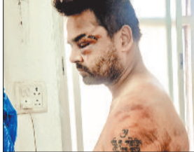
घायल आर्मी का जवान।

सोपत शराब भट्टी के सामने चखना दुकान संचालक ने साथियों के साथ मिलकर राड, चाकू व बेल्ट से आर्मी जवान व साथियों पर जानलेवा हमला कर दिया। इस मारपीट से जवान बुरी तरह से जखमी हो गया और उसे गंभीर हालत में सिम्स में भर्ती किया गया है। मामला बुधवार की शाम का है।