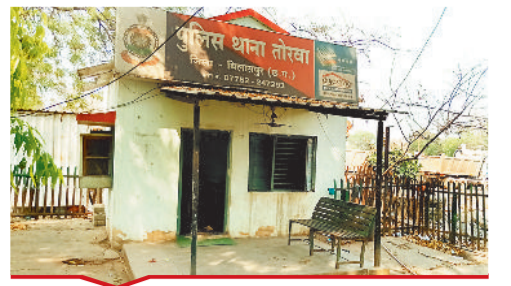
बिलासपुर रेलवे स्टेशन से नहीं की गई तोरवा पुलिस चौकी की शिफ्टिंग।

बिल्हा | मस्तूरी | तखतपुर | मुंगेली | कोटा | लोरमी | सरगांव | पेंड़ा | बेलतरा | रतनपुर | पथरिया