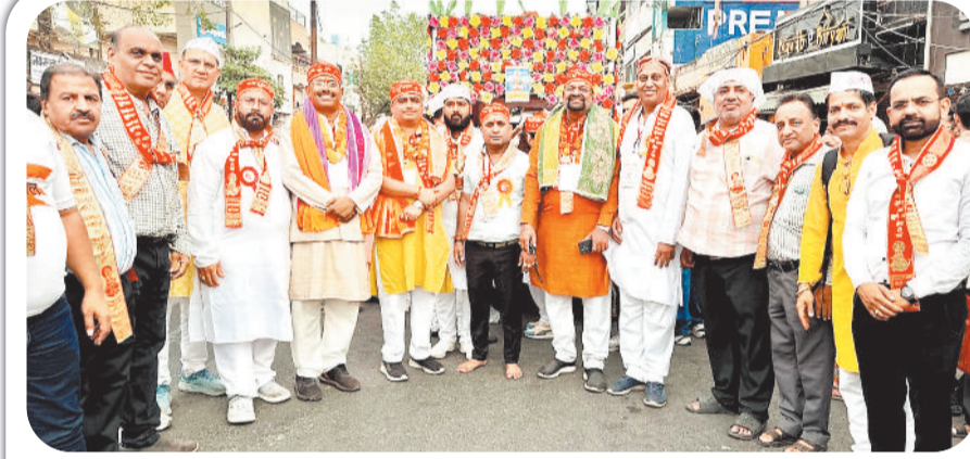
स्कूटर रैली में बुजुर्गों ने भी लिया भाग

शोभायात्रा में भक्त कंवरराम की भजन-कीर्तन करती जीवंत झांकी, खाटू श्याम, वानर सेना, राजस्थानी नृत्य आकर्षण का केन्द्र रहा। शोभायात्रा बुधवारी बाजार से निकलकर जगमल चौक, गांधी चौक, गोल बाजार, सदर बाजार, नेहरू चौक होते हुए सिंधी कॉलोनी भक्त कंवरराम नगर पहुंचकर समाप्त हुई। शोभायात्रा में सिंधी समाज, पूज्य सिंधी सेंट्रल पंचायत, सिंधी नव युवक समिति, सिंधी वाई पंचायत, सिंधी सेंट्रल युवा विंग एवं महिला विंग शामिल रही।