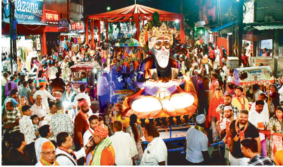
हरिभूमि न्यूज || बिलासपुर

भगवान झूलेलाल, आयोलाल झूलेलाल का जयघोष, डीजे व धुमाल की धुन पर नृत्य करते रहे। जीवंत झांकियां का चौक-चौराहों चैट्टीचंद्र महोत्सव पर भव्यता बढ़ा दी।